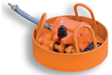
DBRP Ø 300 mm