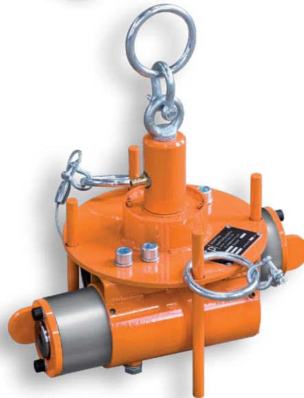
2-Arm-Automatik-Rüttler Ø 350 - 600 mm 2-arm automatic vibrator