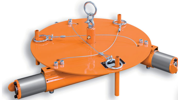
3-Arm-Automatik-Rüttler Ø 1000 - 1600 mm 3-arm automatic vibrator