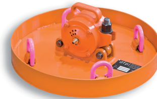
DBRP Ø 600 mm