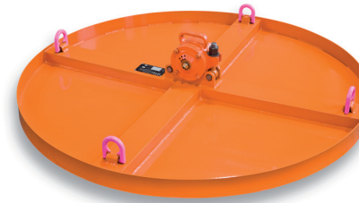
Bodenrüttelplatte DBRP Ø 1500 mm mit Verstärkungskreuz Bottom plate vibrator DBRP with reinforcement cross